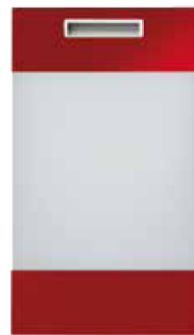
Witryna V2 TAFLA U