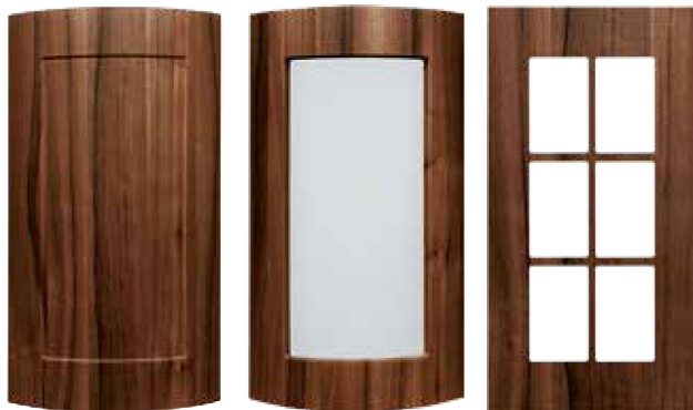
Front pełny gięte